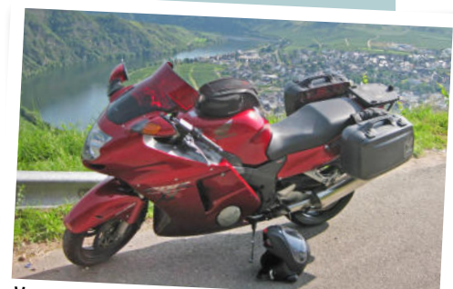
Voor een reis naar Moskou en Sint Petersburg draaide Bart Buddingh zijn hand niet om. Dichter bij huis, zoals hier langs de Moezel, is het echter ook leuk met de Blackbird.

Heeft jouw motor ook een respectabele kilometerstand bereikt én ken je de historie? Meld je dan aan voor een grondige inspectiedoor onze specialisten! Stuur een e-mail aan marathonmotor@mpsadventure.nl met je contactgegevens en informatie over je motor, zoals merk, type, bouwjaar en kilometerstand. Meer info is te vinden op www.mpsadventure.nl .